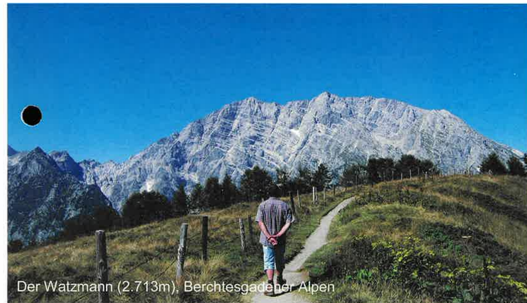
Der Watzmann (2.713m), Berchtesgadener Alpen